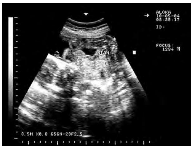
Figura 2. Imagen de ultrasonido en la cual se visualiza producto con dos cabezas y fusión de tórax.