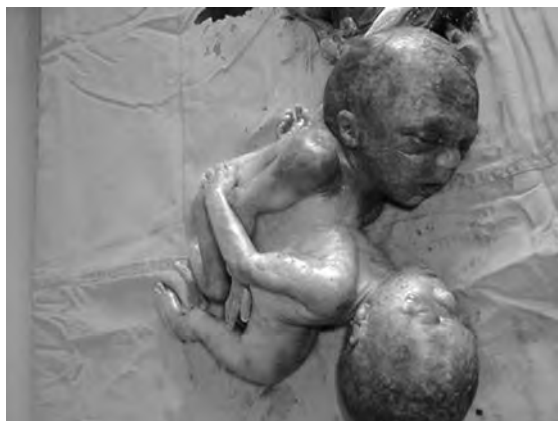
Figura 4. Imagen post-mortem muestra gemelos unidos con fusión ventrolateral de tórax y abdomen.