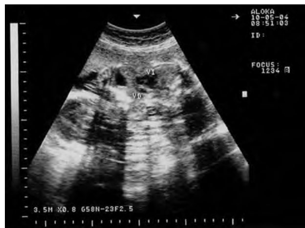
Figura 3. Imagen de ultrasonido donde se visualiza corazón único con cardiopatía compleja, hipertrofia de ventrículo izquierdo, aurícula única.