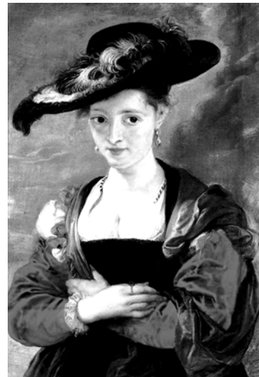
Figura 4. Retrato de Sussanne Fourment. Rubens.

Antón van Dyck nace 22 años después que Rubens, en 1599, en Amberes. Muere en Londres, en diciembre de 1641. Fue un pintor flamenco especialmente dedicado a la realización de retratos. Llegó a ser el primer pintor de la corte en Inglaterra tras una larga estancia en Italia. Es universalmente conocido por sus retratos de la nobleza genovesa y de Carlos I, rey de Inglaterra, de los miembros