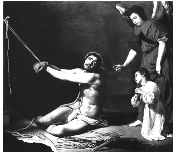
Figura 5. Cristo después de la flagelación. Velázquez.

Son muchas las obras del Renacimiento y el Barroco