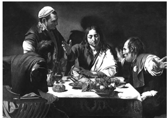
Figura 3. Los discípulos de Emaús. Caravaggio

Tuvo dos matrimonios y pintó a sus dos esposas en numerosas ocasiones. La primera de ellas, Isabela Brandt, fue retratada también por su discípulo Anton van Dyck. El cuadro de Rubens, de 1625, es un óleo sobre lienzo que se muestra en la Galería de los Oficios, en Florencia, el de van Dyck data de 1621, es de mayor tamaño y se exhibe