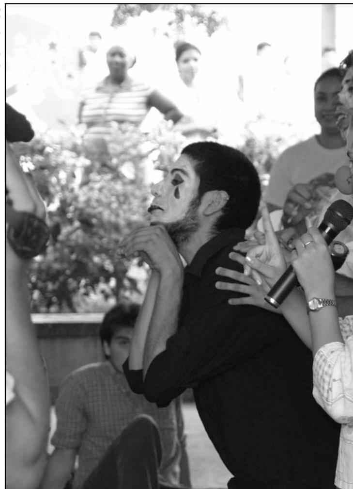
Actividad en la Escuela Latinoamericana de Medicina.