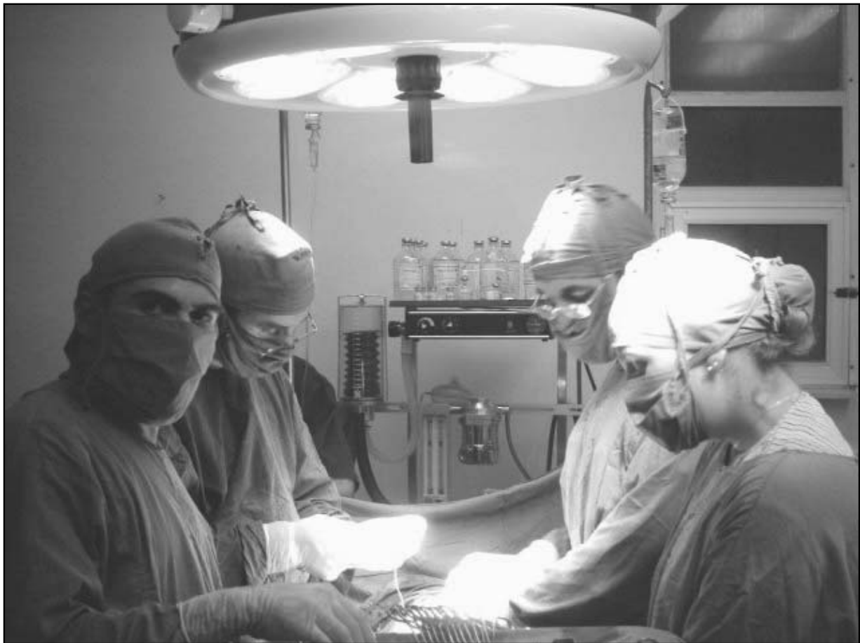
Egresados de la tercera graduación de la Escuela Latinoamericana de Medicina, Facultad "Miguel Enríquez".