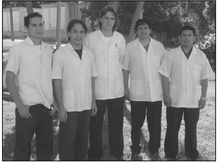
Estudiantes Latinoamericanos de la tercera graduación de la ELAM. Facultad de Medicina de 10 de Octubre.